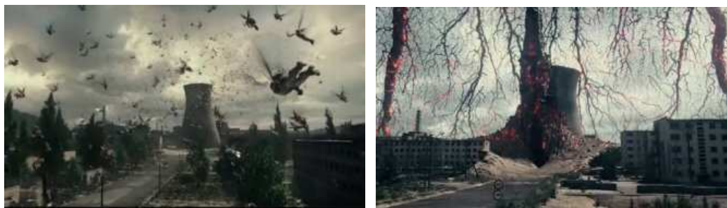
(zábery z filmu "LS": mesto Przemysl, kde sa udial záverečný boj)

Prečo práve na Ukrajine odpálili informačný vírus, prečo práve Černobyl' bol priznaný vo svetovom význame za "zónu vylúčenia"?