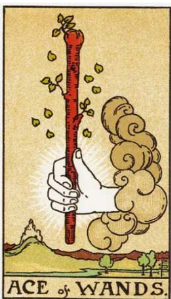
Názov karty: Koreň síl ohňa

Objasnenie (všeobecný význam): «zrodenie», t.j. inicializácia, začiatok niečoho nového, vznik idey; tvorenie, budovanie. Dá mocný prílív energie, impulz: postrkuje, aktivizuje. Umocnenie. Začiatok, zdroj, prapríčina.