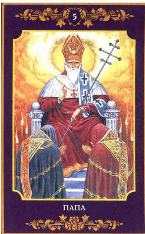
Tarotová karta číslo 5:

Za základnú dielňu týchto kádrov bolo vybrané Medzimorie. Jezuiti 5 , ako je známe, sa veľmi vynasnažili v Kijevskej akadémii, pri výmene dynastií na Rusi aj zámene jedného cirkevného učenia za druhé (spomenieme koňa Júlia, pracujúceho v knižnici, zo série kreslených filmov o Kyjevskom kniežati – tento obraz bude popísaný neskôr v tomto článku).