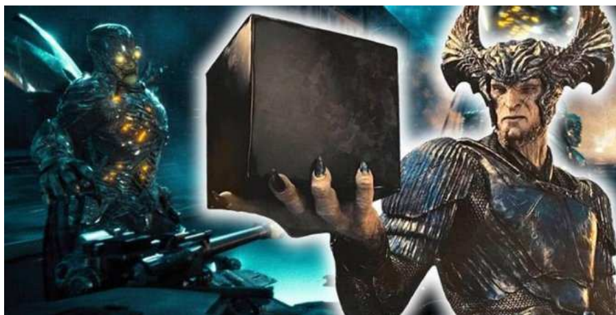
Na fotke: Stepný vlk drží materskú kocku, vedľa je jeden zo špiónov Stepného vlka