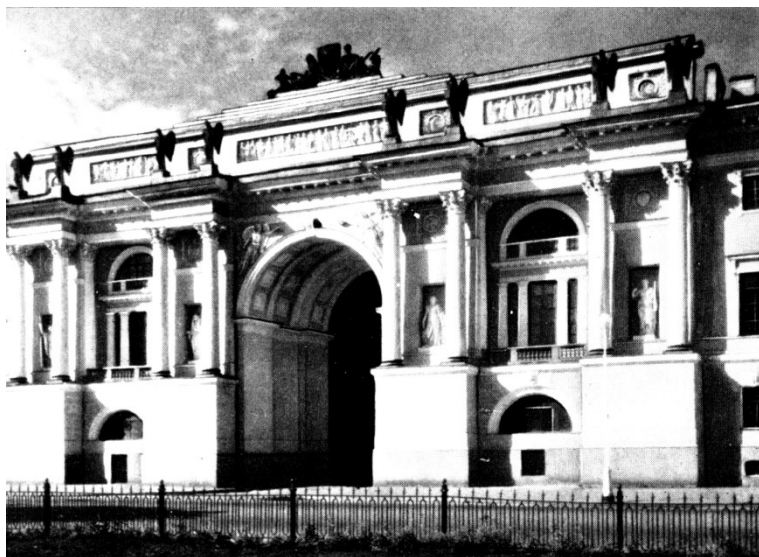
Obrázek 2: Oblouk sjednocující Senát a Koncil se dvěma sochami "géniů".

Přes mystickou vazbu „jako živých mramorových lvů strážných“, z nepochopitelných důvodů, z nichž se v historii globální civilizace odněkud zjevilo židovstvo (s Jevgenijem jsme se rozloučili v předvečer povodně), se otevírá druhá smyslová řada básně. Mystika Puškinem popsané scény je v tom, že na Senátním náměstí existují dvě budovy se lvy u vchodu. Jsou umístěni, jak je vidět z uvedeného na obr. 1, na dvou protilehlých rozích náměstí: jihovýchodním, daleko od „Měděného jezdce“ je dům Lobanova – Rostovského, a na severozápadním, blízko „Měděnému jezdcí“, je Lavaljův dům, který tvoří jediný architektonický komplex se senátem a Koncilem.