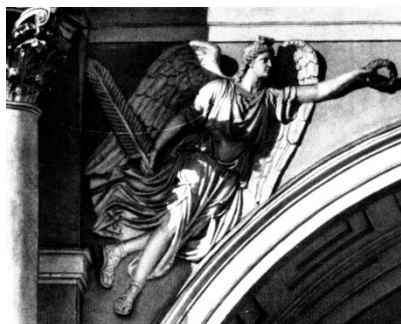
Obrázek 3: Socha "génia"