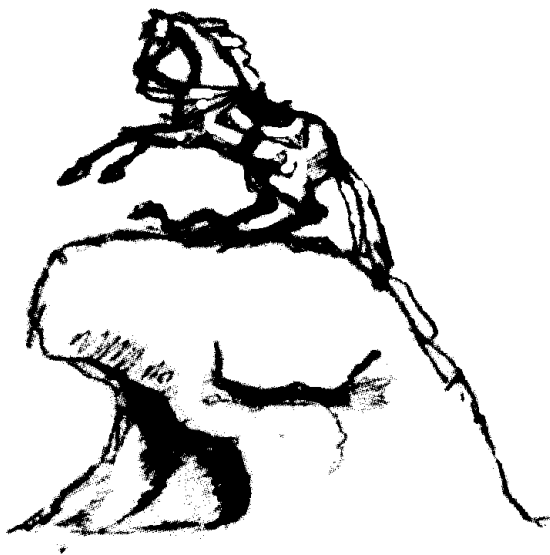
Obr.5 „Měděný jezdec“ bez Petra (neviditelný jezdec). Kresba A.S.Puškina. Zdroj: Kompletní dílo Puškina, 1996, svazek 18.

To, že „chudák nerozumný“ měl ve skutečnosti co do činění ne s carem Petrem a ne s Bohem, ale s vlastním, jím neuvědomovaným produktem individuální a kolektivní psychiky při směně mnoha generací židů, zamknutých „levity-strážci“ na biblický egregor, je viditelné nejen z textu básně, ale také z jedné vynikající ilustrace k ní, vytvořené samotným básníkem během jejího napsání.