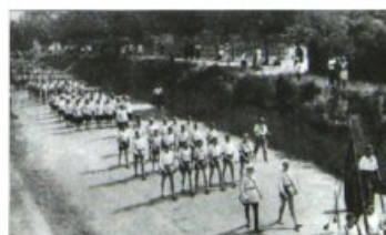
Строй коммунаров в Сочи, 1931 г.

http://img1.labirint.ru/books/321958/scrn_big_1.jpg