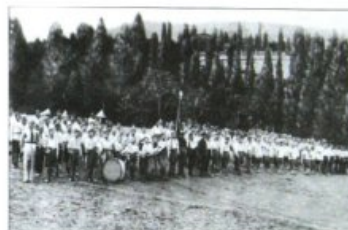
Коммунары в Ялте — «Марш 30-го года»