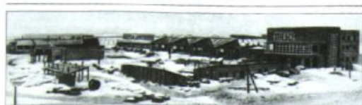
Общий вид на завод электронинструментов в коммуне