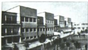
Коридор завода фотоаппаратов коммуну

Продукция коммунаров: 1. фотоаппарат ФЭД 2. электросерважик типа ФДЗ и ФД-2